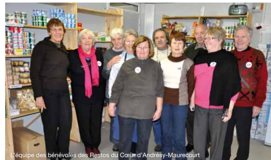
L'équipe des bénévoles des Restos du Cœur d'Andrésy-Maurecourt

En France, ce sont donc plus de 2000 centres qui assurent la distribution. Les personnes aidées s'y rendent une ou plusieurs fois par semaine. Ce sont aussi des lieux d'accueil, de rencontre et d'échange, où l'on peut boire un café, passer un moment au chaud, établir des contacts et, ainsi, aller plus loin dans l'insertion. ▶