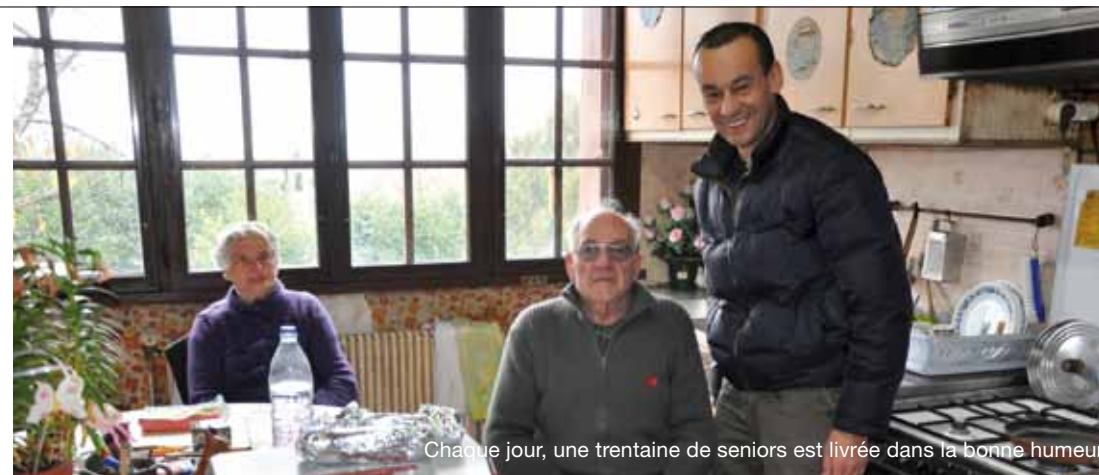
Chaque jour, une trentaine de seniors est livrée dans la bonne humeur.

chaud et d'un dessert est livré au domicile entre 10h et 12h. « Les repas sont confectionnés par la restauration municipale dans une valsette assurant ainsi une totale hygiène et la tenue au chaud des assiettes. Les menus sont établis une semaine à l'avance, ils peuvent ainsi connaître la composition de leur repas » explique un agent communal de la restauration municipale. Et de poursuivre : « ils profitent également des petites douceurs que les personnes âgées de la résidence des Magnolias peuvent avoir à l'occasion par exemple d'un anniversaire. Il faut savoir que les seniors de la RPA et ceux que nous livrons ont exactement le même repas excepté l'été lorsqu'il y a une glace au dessert. Dans ce cas, nous la remplaçons par une pâtisserie ».