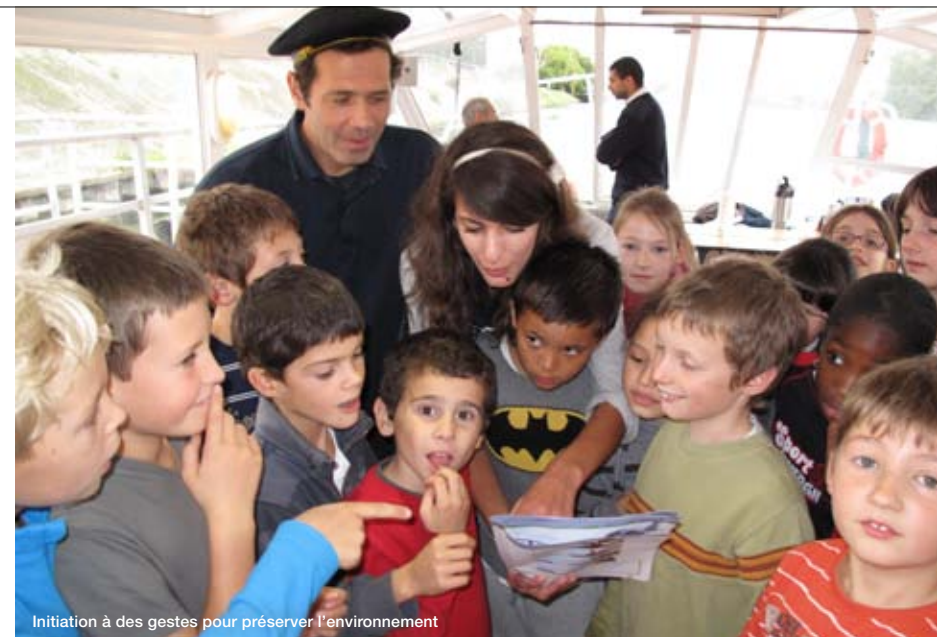
Initiation à des gestes pour préserver l'environnement