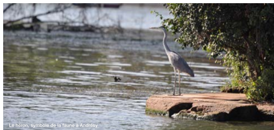
Le héron, symbole de la faune à Andrésy

Sensibiliser les jeunes enfants à la beauté et à la fragilité de l'environnement de la Vallée de Seine ainsi qu'à des modes de consommation durables à travers des actions sur le terrain est l'une des principales vocations de la ville d'Andrésy. En octobre dernier, de nombreux enfants ont ainsi participé à des actions pédagogiques mises en place par l'association Vive la Seine.