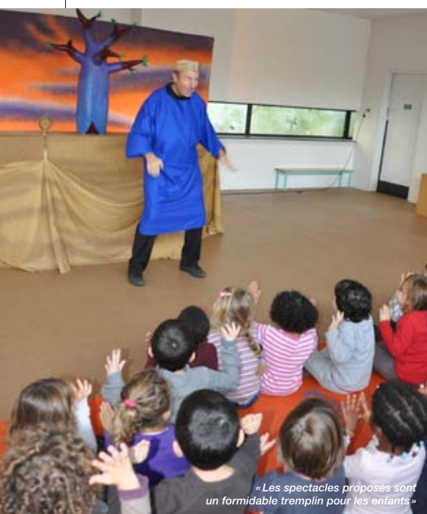
« Les spectacles proposés sont un formidable tremplin pour les enfants »

Organisés par la ville d'Andrésy, les accueils de loisirs sont destinés aux enfants scolarisés âgés de 3 à 12 ans, ils sont ouverts en journée complète ou en demi-journée, chaque mercredi et durant les vacances scolaires (hors week-end et jours fériés). Afin d'apporter des réponses adaptées aux besoins des enfants qui prennent en compte les différents stades de développement sur notre ville, les structures de loisirs