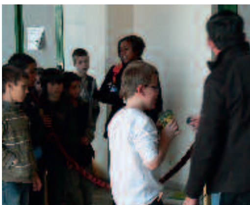
Des jeux ont été organisés dans l'Espace Julien-Green.