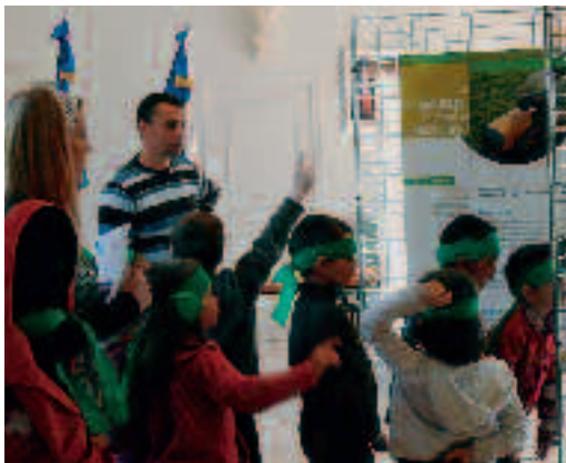
Les enfants des accueils de loisirs ont découvert des expositions en mairie.

Belle réussite pour cette première Semaine du développement durable organisée à Andrésy dans le cadre de son Agenda 21. Les Andrésiens de tous les âges ont participé à de nombreuses manifestations proposées et organisées par l'ensemble des directeurs de Service de la ville d'Andrésy du 1er au 8 avril derniers. Vous avez pu être initiés et sensibilisés par de nombreuses actions le plus souvent ludiques aux enjeux de la consommation durable. Rappels en images !