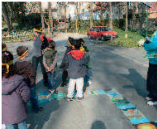
Un jeu de l'oie géant pour une initiation ludique au développement durable.