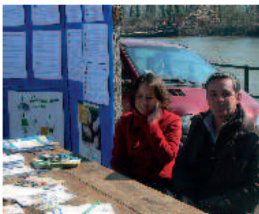
Un stand itinérant a permis aux Andrésiens d'être sensibilisés à l'Agenda 21.