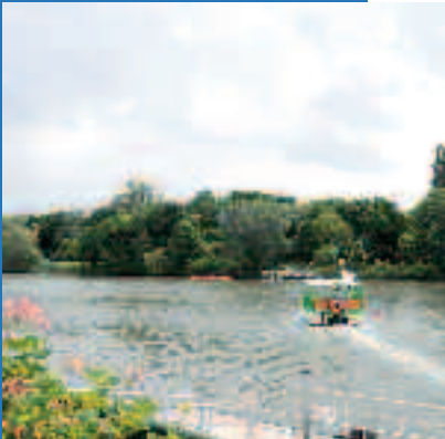
Île Nancy Ouverture le 11 avril www.andresy.com