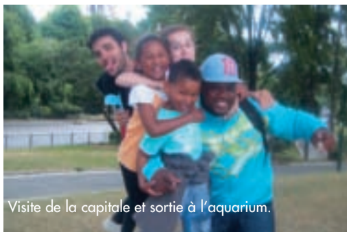
Visite de la capitale et sortie à l'aquarium.

Les jeunes enfants l'accueil de loisirs Saint-Exupéry ont passé eux aussi d'agréables vacances ! Sur le thème des aventuriers de l'été, les enfants ont pu découvrir des activités diverses et variées. Réalisation d'une fresque sous-marine, fabrication de chars à voile, de couronnes indiennes, de jupes indiennes et de tipis, construction de radeaux, etc... Bonne humeur et découverte, tel était le maître mot de ces vacances. ♦