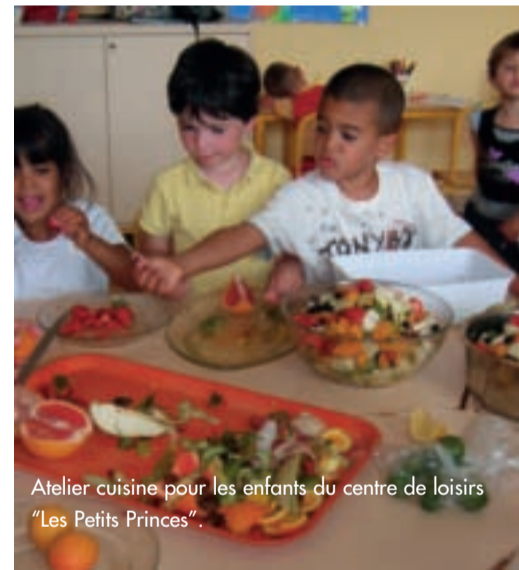
Atelier cuisine pour les enfants du centre de loisirs "Les Petits Princes".