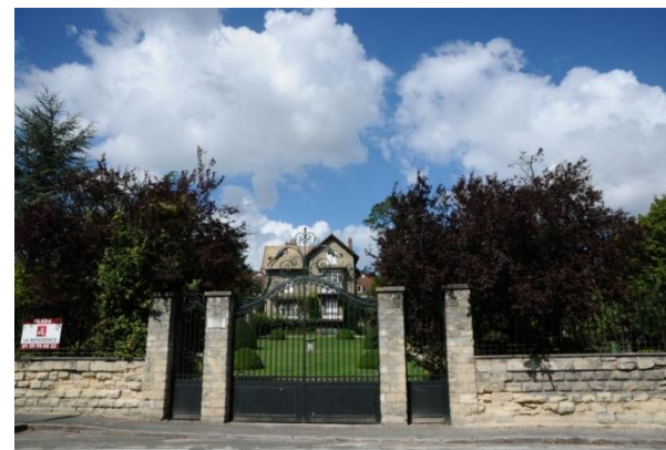
6 boulevard Noël-Marc, fiche patrimoniale n°13