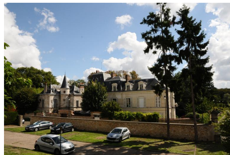
4 avenue d'Eylau, fiche patrimoniale n°09

La plupart des constructions de cette typologie sont repérées comme exceptionnelles ou remarquables. On se référera aux fiches patrimoniales nominatives.