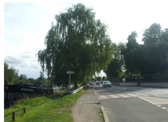
Boulevard Noël Marc

L'aménagement de l'espace public devrait être très qualifiant (grandes qualités des matériaux, du mobilier, ou des plantations...) pour être en accord avec la qualité des bâtiments environnants. Les espaces piétonniers pourraient gagner en confort et en surface.