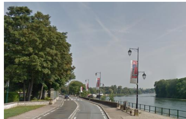
Boulevard Noël Marc

Sur cette séquence, l'espace public des quais de Seine est dominé par l'espace dédié à la voiture.