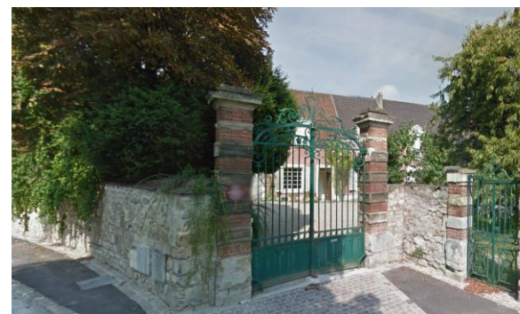
2 rue du Moussel

La plupart des porches et des murs à protéger relèvent de cette typologie.