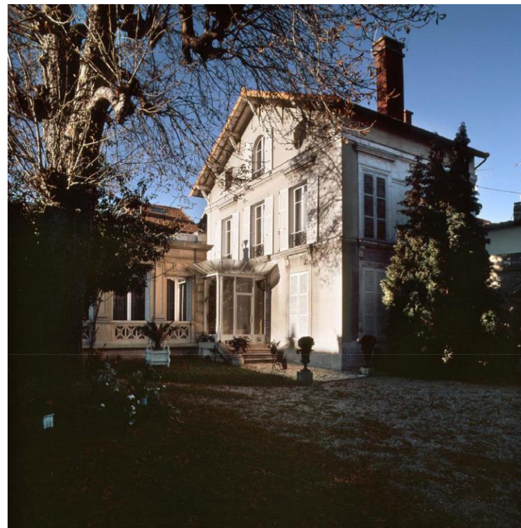
60 boulevard Noël Marc, fiche patrimoniale n°25