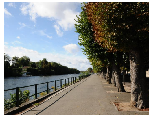
Promenade du Docteur Giffard