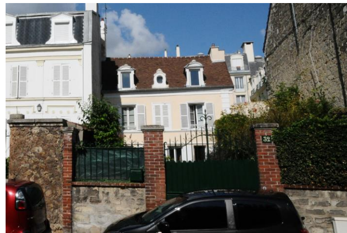
32 boulevard Noël Marc, fiche patrimoniale n°19