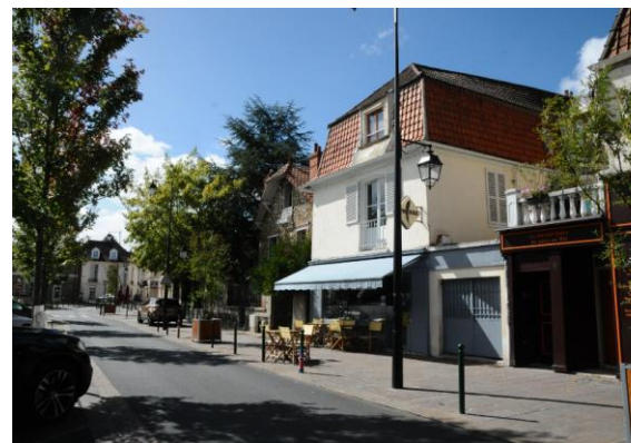
Boulevard Noël Marc