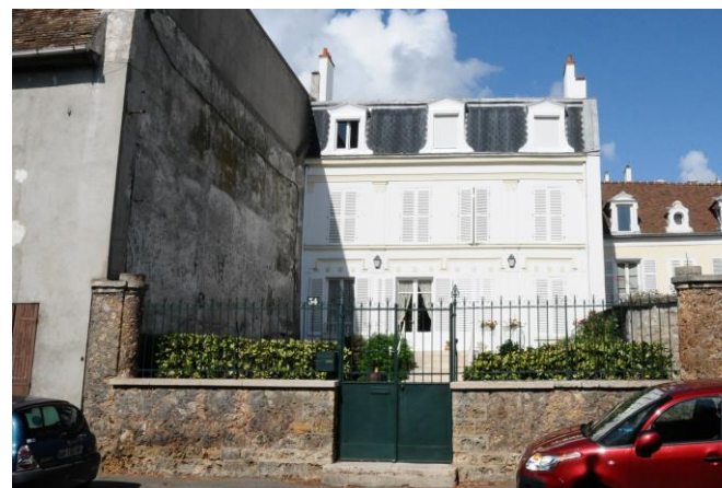
34 boulevard Noël Marc, fiche patrimoniale n°20