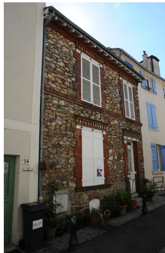
22 rue de l'Église, fiche patrimoniale n°14