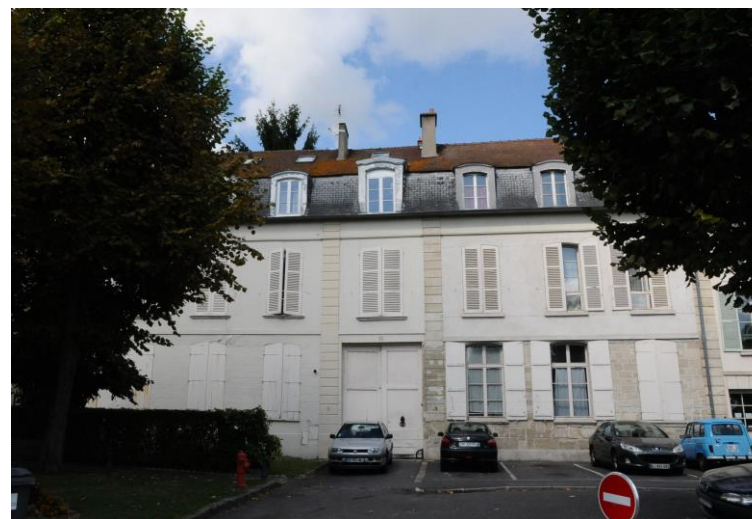
10-12 Boulevard Noël Marc, fiche patrimoniale n°16

La plupart des constructions de cette typologie sont repérées comme exceptionnelles ou remarquables. On se référera aux fiches patrimoniales nominatives.