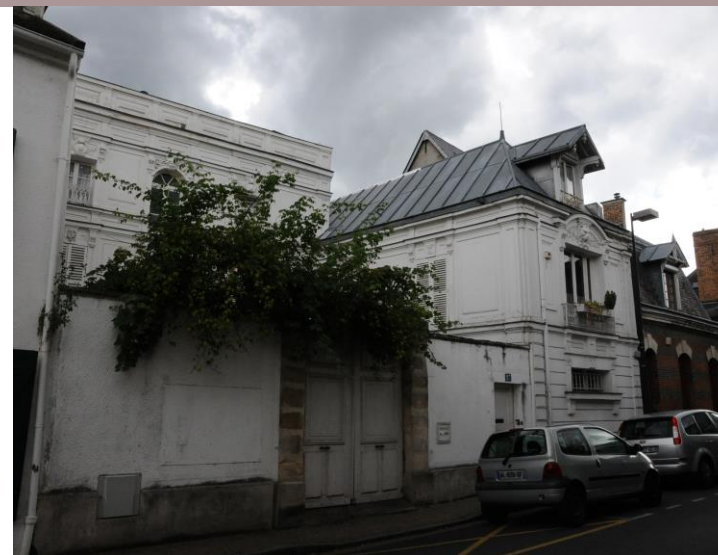
27 rue du Général Leclerc, fiche patrimoniale n°28