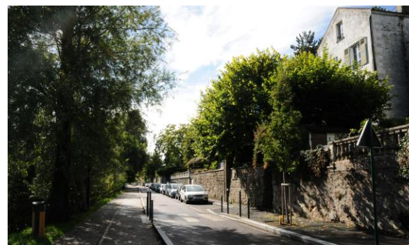
Quai de Seine