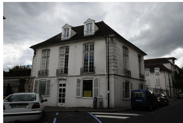
1 rue du Général Leclerc, fiche patrimoniale n°27

La plupart des constructions de cette typologie sont repérées comme exceptionnelles ou remarquables. On se référera aux fiches patrimoniales nominatives.