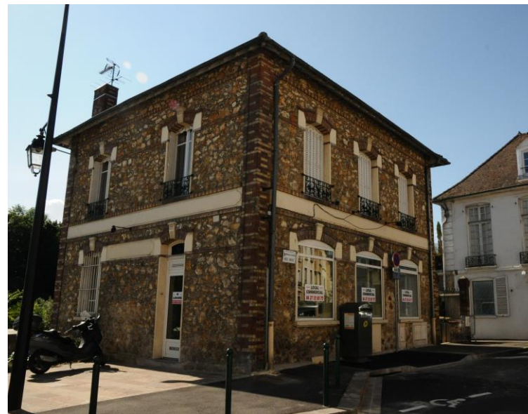
63 boulevard Noël Marc, fiche patrimoniale n°26