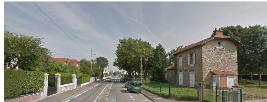
Rue du Maréchal Foch

La rue Charles Infroit a un caractère particulièrement intéressant grâce à la présence des jardins situés en contre-bas des maisons de l'avenue d'Eylau. Cette rue bénéficie d'une perspective sur un bosquet de pins.