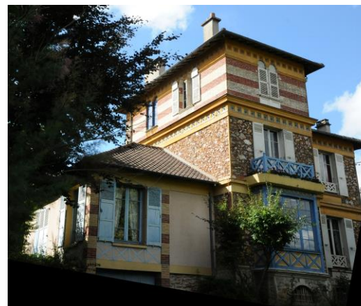
1 rue de la Halte, fiche patrimoniale n°63

Quelques unes des constructions de cette typologie sont repérées comme remarquables. On se référera aux fiches patrimoniales nominatives. Les autres sont repérées comme intéressantes et faisant partie d'un linéaire de façades à préserver. Un certain nombre de constructions de cette typologie sont repérées comme exceptionnelles ou remarquables. On se référera aux fiches patrimoniales nominatives.