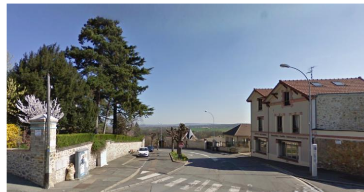
Rue de Triel