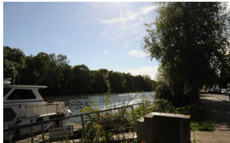
L'île vue depuis le quai de Seine

Quelques constructions sont implantées sur l'île. Leur présence se fait discrète grâce à l'abondance de la végétation.