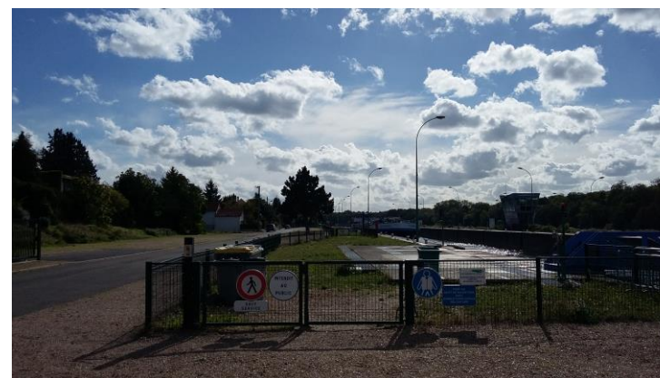
Le quai de l'île Peygrand

Par ailleurs, les éléments techniques et clôtures pourraient faire l'objet d'un traitement plus qualitatif.