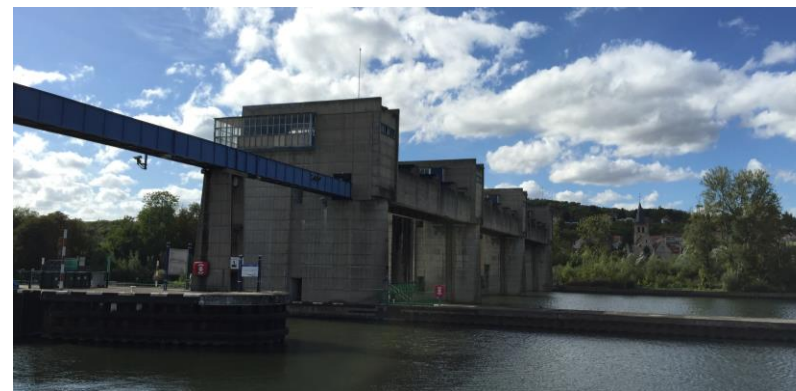
Le barrage d'Andrésey

Le chemin de halage persiste dans la partie nord du secteur.