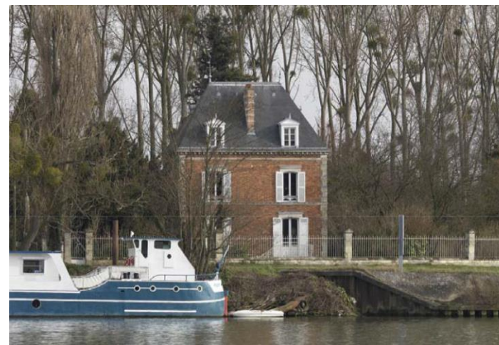
Quai de l'île au bac, fiche patrimoniale n°40

Quelques unes des constructions de cette typologie sont repérées comme remarquables. On se référera aux fiches patrimoniales nominatives. Les autres sont repérées comme intéressantes et faisant partie d'un linéaire de façades à préserver. Un certain nombre de constructions de cette typologie sont repérées comme exceptionnelles ou remarquables. On se référera aux fiches patrimoniales nominatives.