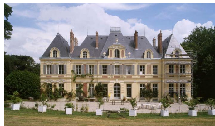
Chateau du Faÿ, Lieu dit le Faÿ, fiche patrimoniale n°75

Toutes les constructions et les éléments architecturaux exceptionnels font l'objet, de fiches patrimoniales nominatives qui comportent des recommandations personnalisées qui sont à prendre en compte lors de travaux réalisés.