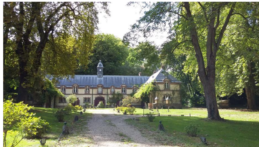
Vue du domaine du Faj

Ce secteur présente un caractère isolé par rapport au cœur construit de la ville. La majorité des vues sont bloquées par les collines. Ce secteur possède un enjeu important quant à la préservation du caractère du parc et des implantations bâties.