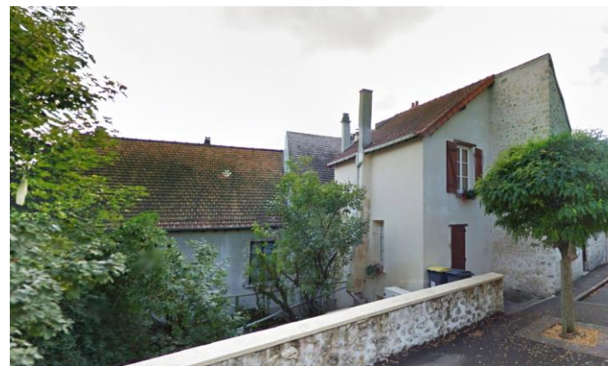
49-51-53 rue du Général Leclerc