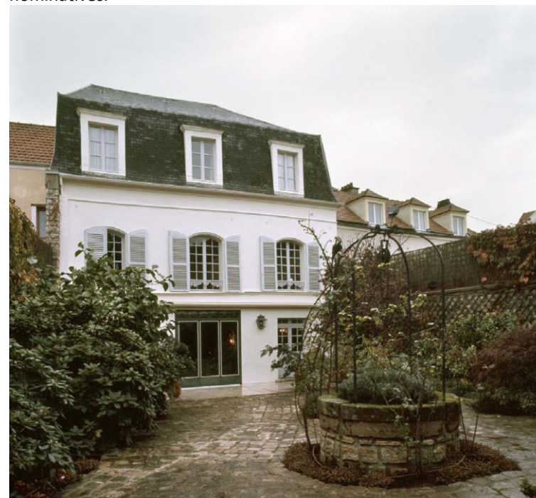
Fiche patrimoniale n°31

La plupart des constructions de cette typologie sont repérées comme exceptionnelles ou remarquables. On se référera aux fiches patrimoniales nominatives.