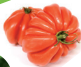
TOMATES M. De Vos Chailly-en-Bière (77)