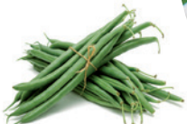
HARICOTS VERTS VEXIN Hugo Ferme du Fayel (60)