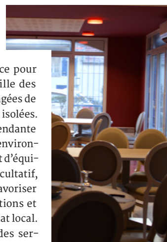
Résidence « Les Magnolias » 60, rue des Courcieux 01 39 70 98 79 lesmagnolias@andresy.com

ÉTABLISSEMENT PUBLIC non médicalisé, la Résidence pour Personnes Âgées (R.P.A.) « Les Magnolias » accueille des personnes valides, autonomes, seules ou en couple âgées de plus de 60 ans ne désirant ou ne pouvant plus vivre isolées. Cette résidence leur permet de vivre de façon indépendante dans un appartement confortable tout en offrant un environnement collectif rassurant. Les résidents bénéficient d'équipements et de services collectifs dont l'usage est facultatif, qui visent à rompre l'isolement entre résidents et à favoriser les échanges avec l'extérieur : restauration, animations et services divers dans l'établissement ou en partenariat local. Situés en centre-ville, proches des commerces, des services et des transports (SNCF, Bus), ces logements privatifs assurent les mêmes fonctions qu'un logement familial. Les résidents y installent leurs meubles, aménagent les lieux selon leur goût et reconstituent ainsi leur univers familial. Vous souhaitez avoir plus de renseignements ? Contactez dès à présent la RPA Les Magnolias au 01 39 70 98 79. ●