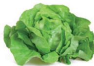
SALADES M. Guehenec Mesnil-le-Roi (78)